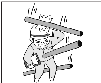
落下物によるケガ