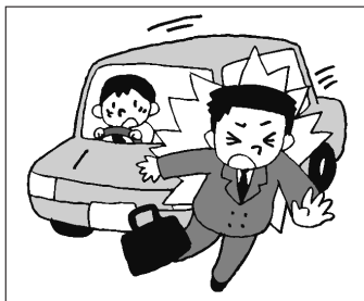
交通事故によるケガ